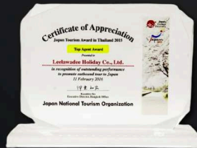
รางวัลนักดีไซน์เส้นทางยอดเยี่ยม ตั้งแต่ ปี 2012-2022 จาก JNTO