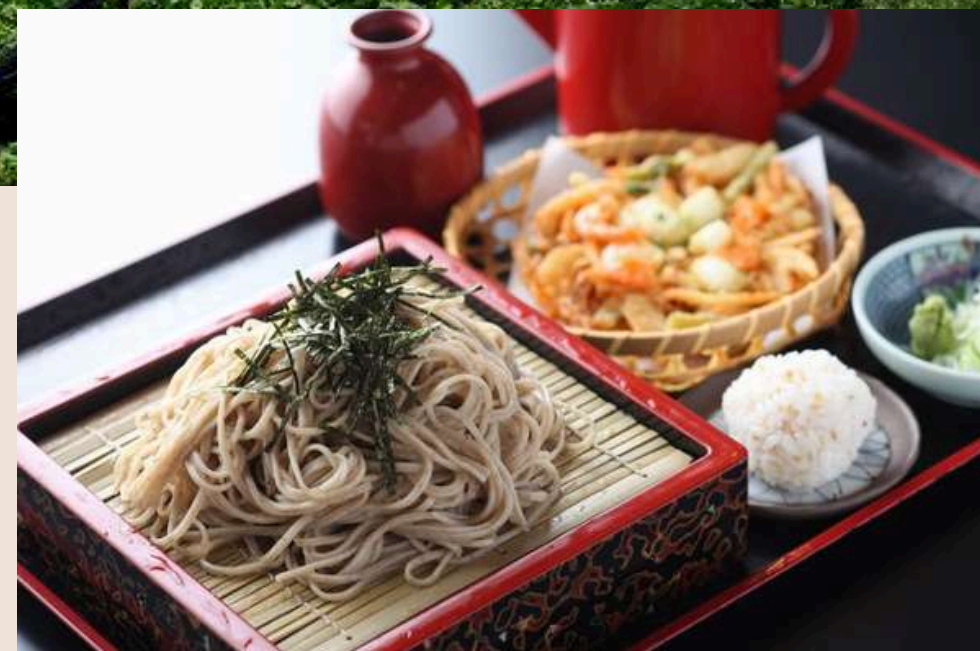
อาหารกลางวัน แนะนำ เมนูโซบะ

ให้ท่านได้สนุกสนานกับวิถีแห่งธรรมชาติ ด้วยการชม ฟาร์มเพาะวาซาบิ ต้นวาซาบิอ่อนๆที่กำลังเติบโตในน้ำใสสะอาดบริสุทธิ์ ที่ละลายมาจากหิมะบนเทือกเขาแอลป์ ทำให้ วาซาบิที่ได้มีคุณภาพดีที่สุดในญี่ปุ่น เป็นอีกหนึ่งจุดหมาย การเดินทางดีๆ ที่นักท่องเที่ยวต้องมาชมให้ได้ นอกจากนี้ใน ฟาร์มยังมีสินค้าคุณภาพดีอีกมากมายให้ได้เลือกซื้อเลือก ชม เช่น ไอศกรีมวาซาบิรสชาติดี เส้นโซบะวาซาบิอร่อยๆ แกงกะหรือวาซาบิที่เป็นเมนูโปรดของชาวญี่ปุ่น และไส้กรอก วาซาบิ ฯลฯ