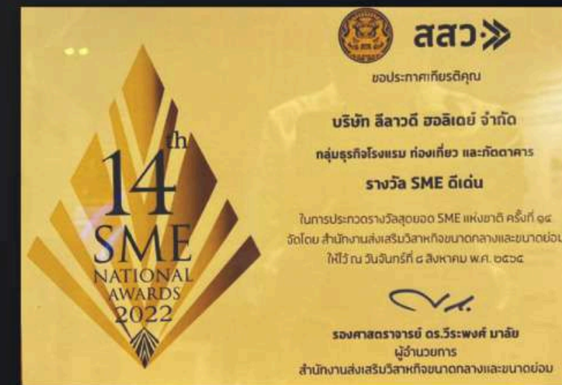
รางวัล SME ดีเด่นแห่งชาติ ครั้งที่ 14 จาก สสว.