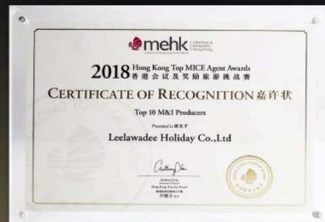
Hong Kong Top Mice Agent Awards